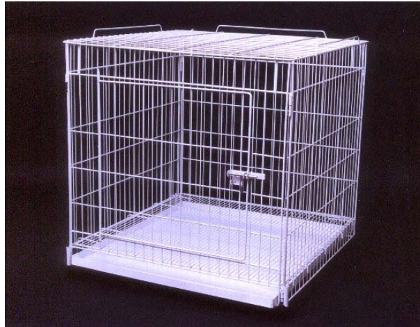
Figura 6 – Jaulas para confinamento temporário de mamíferos. Varetas de inox com hastes de 8 e 4 mm.