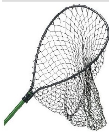
Figura 3 – Puçá convencional adquirido em lojas de caça e pesca.