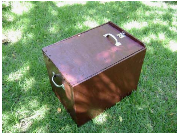
Figura 4 – Caixa confeccionada em compensado utilizada para o transporte seguro de animais.