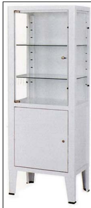
Figura 7 – Armário de medicamentos de epoxy.