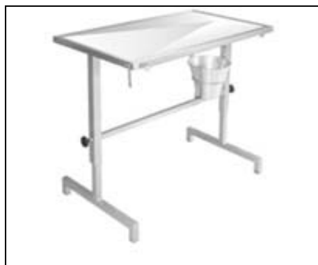
Figura 5 – Mesa veterinária para cirurgia com regulagem de altura e inclinação, toda em inox e travas para amarração. Acompanha balde e suporte de soro.