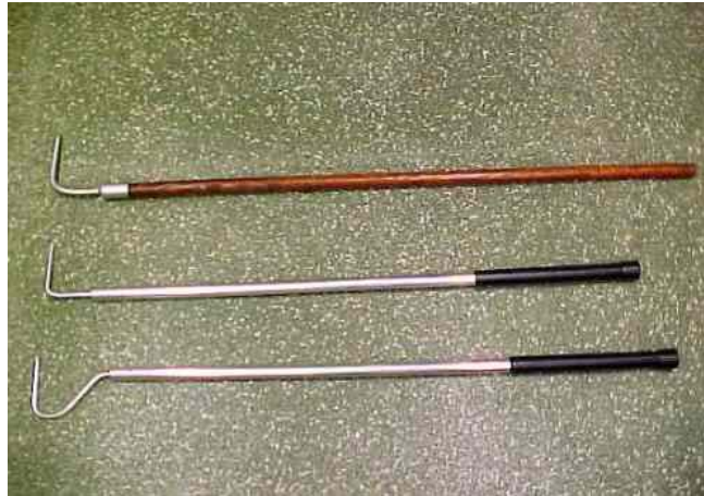
Figura 1 – Ganchos para captura de serpentes. Esse instrumento, confeccionado em alumínio (haste) e aço inoxidável (gancho propriamente dito), permite o manuseio seguro de serpentes sem que haja necessidade da aproximação excessiva do coletor.